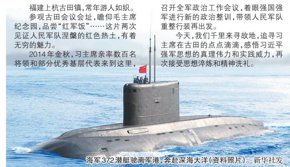
海军372潜艇驶离军港,奔赴深海外洋(资料照片)。

这几年,党中央、中央军委和习主席强力惩贪肃腐,坚持无禁区、全覆盖、零容忍,坚持重遏制、强高压、长震慑,严肃查处郭