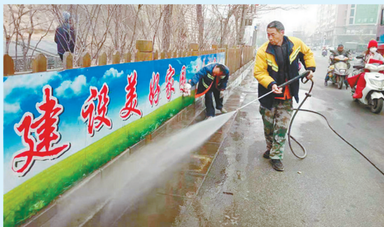
昨日上午,管城区东大街街道组织200余名党员志愿者开展“除尘减霾,擦靓辖区——大擦洗大清洁”活动。清理绿化带垃圾70余处,清理纸屑烟头70余处,擦洗城市家具100余处,扮靓辖区环境,美化居民生活。

“市容市貌大提升不但要美容,还要塑形、铸魂。除了前面5件,我们还要做好装修和布景这两件事。”淮河路街道党工委副书记蔡召玉介绍。淮河路街道将在原来5条样板路的基础上,重点围绕基础差、离群众生活最近的支路背街,进行街景整治,形成“一街一特色”,用工程措施补齐城市家居、门头立面、便民服务场所等方面存在的短板,打造一批特色街巷。