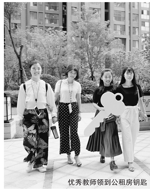
优秀教师领到公租房钥匙

百舸争流,奋楫者先。在新的一年里,管城教育人将以时不我待的紧迫感、舍我其谁的使命感,真抓实干、开拓创新,奋勇向前、攻坚克难,为加快推进教育现代化、建设教育强区、办好人民满意的管城教育而努力奋斗。