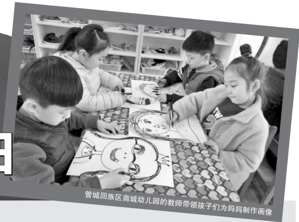
管城回族区商城幼儿园的教师带领孩子们为妈妈制作画像

为庆祝“三八”妇女节,让女教师过一个健康、和谐、快乐、温馨、难忘而有意义的节日,我市多所学校分别开展了形式多样的庆祝活动。