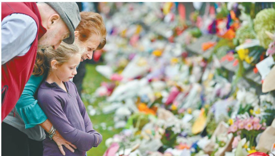
3月17日,在新西兰克赖斯特彻奇,人们悼念枪击案遇难者。

新华社新西兰克赖斯特彻奇3月17日电(李惠子 卢怀谦)新西兰南岛克赖斯特彻奇市两座清真寺15日发生严重枪击事件,17日伤亡人数已上升至50死50伤。新西兰全国增加警力部署,同时各地展开悼念活动。