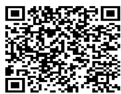
扫描二维码 查看全文