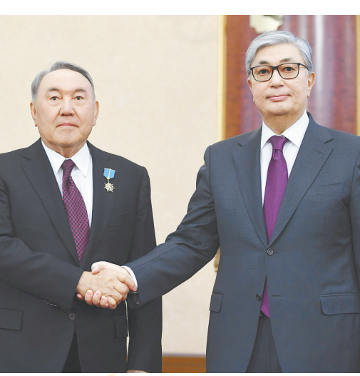
3月20日,在哈萨克斯坦首都阿斯塔纳,托卡耶夫(右)与首任总统纳扎尔巴耶夫握手。

据新华社阿斯塔纳3月20日电(记者 张继业)哈萨克斯坦议会两院联席会议暨总统就职典礼20日在首都阿斯塔纳举行,原议会上院议长托卡耶夫根据宪法宣誓就任哈萨克斯坦总统。