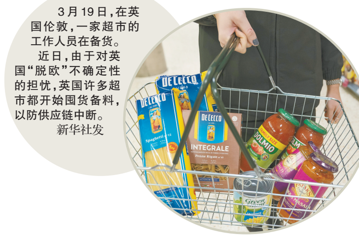
3月19日,在英国伦敦,一家超市的工作人员在备货。近日,由于对英国“脱欧”不确定性的担忧,英国许多超市都开始囤货备料,以防供应链中断。

英国首相特雷莎·梅20日在议会下院说,她已向欧盟递交信函,正式提出推迟英国“脱欧”的申请。欧洲联盟成员国官员19日曾喊话,“恳求”英国方面就退出欧洲联盟“给个准信”,不要继续“玩游戏”。