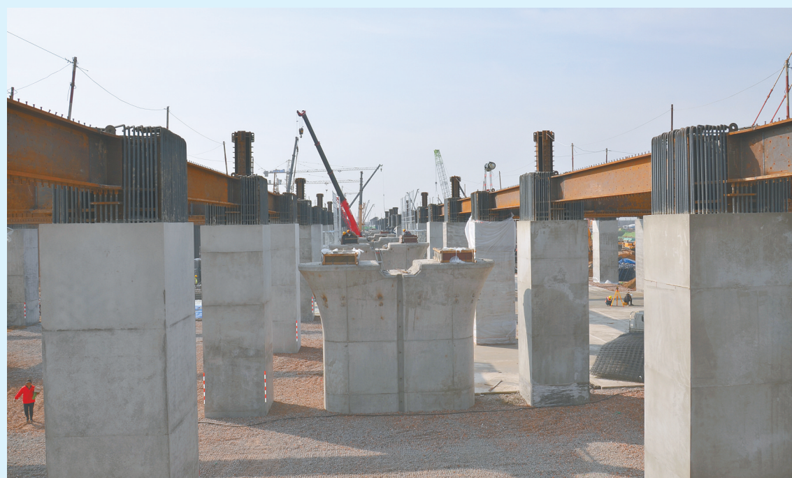
3月22日,郑州高铁南站附近郑万正线桥梁下部结构施工全部完成,为郑万铁路河南段4月10日架设最后23孔箱梁奠定了坚实基础,也为8月1日郑万正线联调联试创造了有利条件。