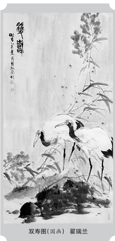
双寿图(国画) 翟瑞兰