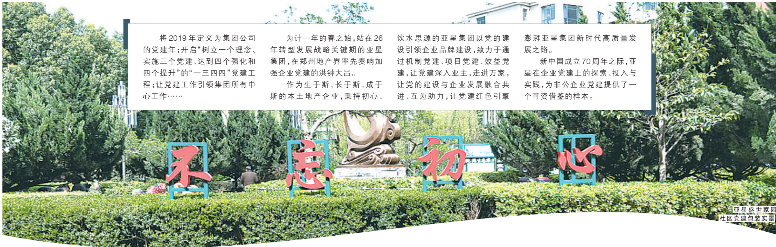
亚星盛世家园社区党建包装实景

澎湃亚星集团新时代高质量发展之路。新中国成立70周年之际,亚星在企业党建上的探索、投入与实践,为非公企业党建提供了一个可资借鉴的样本。