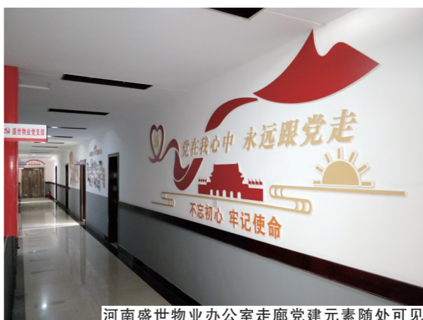
河南盛世物业办公室走廊党建元素随处可见

时,亚星集团公司党员可以凭党员“卡式管理”的积分,兑换“物业费减免、维修费免工费、亲友购房优惠”等独特服务。未来,积分兑换还将向社区党员、热心公益的志愿者等拓展,“亚星党建服务超市”将真正成为党群共画同心圆的一个有效阵地。