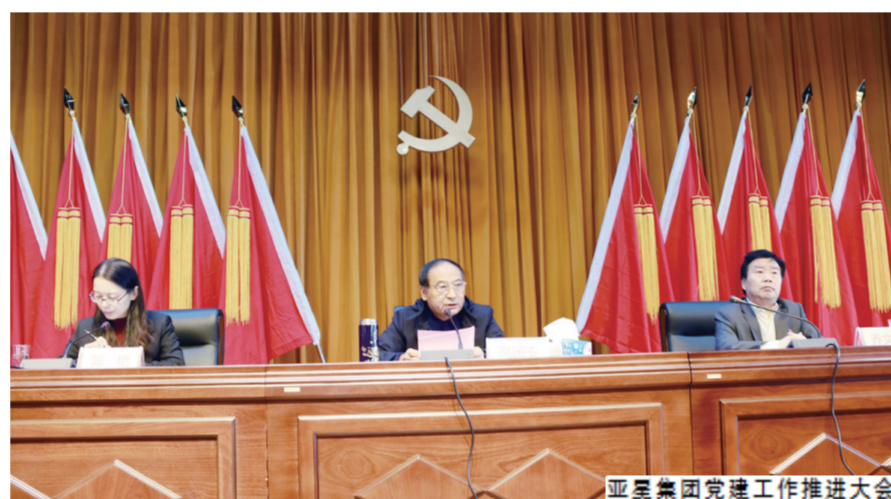
亚星集团党建工作推进大会

加强党建,久久为功。如是一系列条分缕析的机制体制建设,将力保党建真有效、有章法、有落实、有实效,全面彰显亚星党建的特色与魅力。