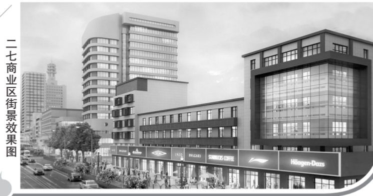
二七商业区街景效果图