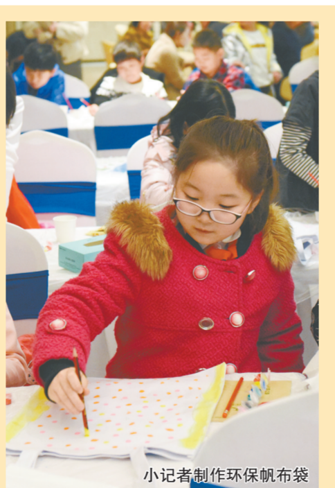
小记者制作环保帆布袋