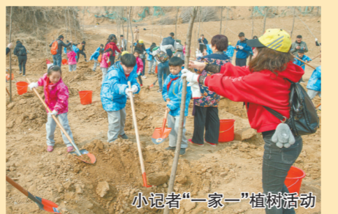
小记者“一家一”植树活动