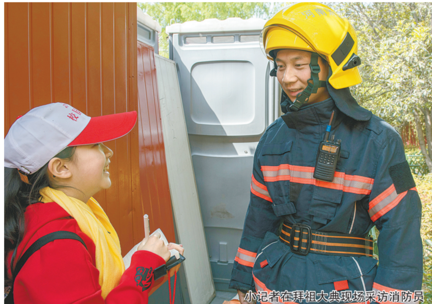
小记者在拜祖大典现场采访消防员

正如一位辅导老师所说的那样,小记者活动不是简单的走走看看,而是让孩子在实践积累中建立自我认识,自我发展。引领他们走出教室,与自然为友,在真实的情景体验中,获取有温度的知识,形成适应未来社会发展的必备品格和关键能力。