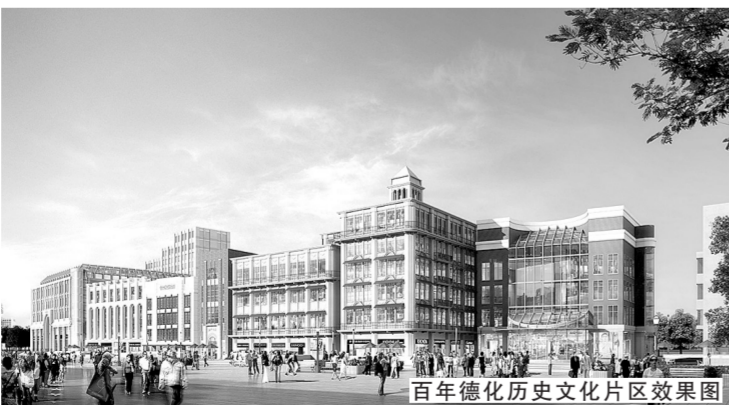
百年德化历史文化片区效果图