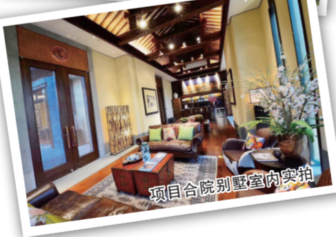
项目合院别墅室内实拍