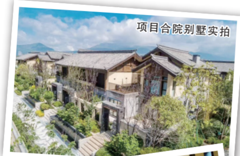
项目合院别墅实拍