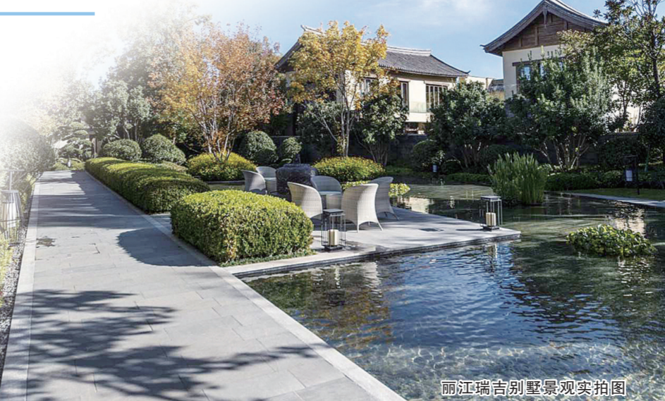
丽江瑞吉别墅区实拍图