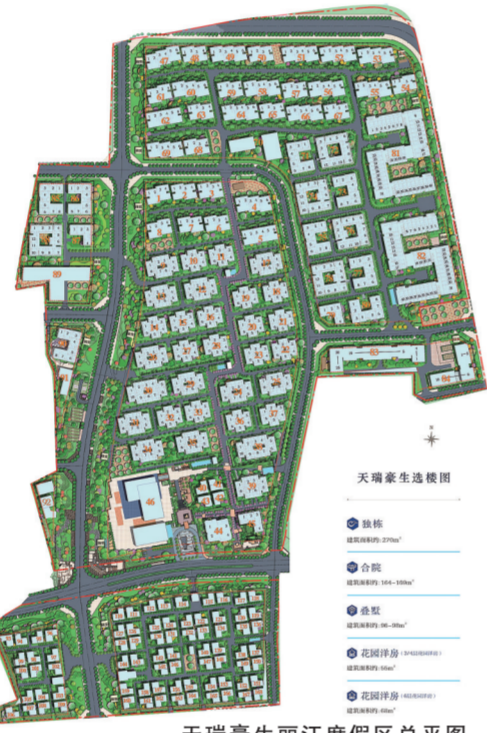
天瑞豪生丽江度假区总平面图

尔夫物业、酒店物业、温泉物业、雪山物业,等等。郑报M酒店全程托管的高端定制全精装70年住宅产权纯洋房康养社区,不仅集上述优势于一身,项目自身的建筑形态呈“5”字形,自拥两个花园,配备一个房车营地,将购进德国定制房车,为业主和客人提供出行服务;项目还将配备康养中心,呵护业主和客户的身心健康。