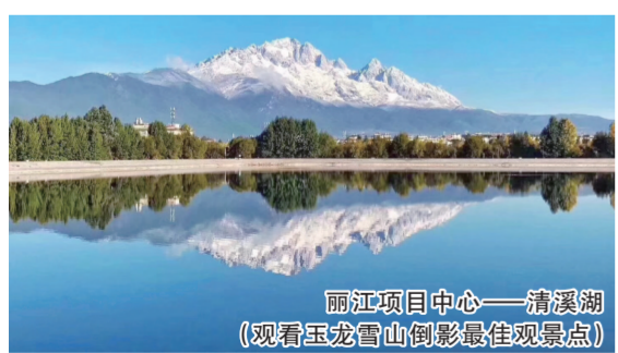
丽江项目中心——清溪湖 (观看玉龙雪山倒影最佳 viewpoint)

2012~2017年,丽江旅游业发展势头良好,旅游人数不断增长,6年年均复合增长率达20.54%。