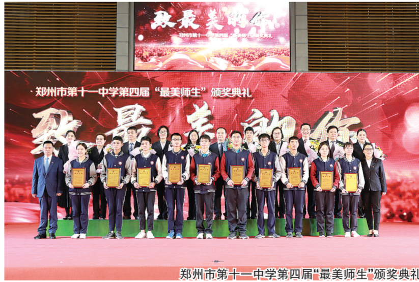
郑州市第十一中学第四届“最美师生”颁奖典礼

因此,在十一中,对于学生自主阅读、社团活动、提问质疑、自我展示等方面的要求会非常宽松,并为他们搭建广阔的展示舞台。围绕学术科技类、文化艺术类、兴趣爱好类、体育健身类、志愿健身类等五大领域开设了40余个社团,为学生提供了展示风采、历练成长、自主发展的广阔平台;“三级五线”特色创客教育体系和星火创客空间,为学生创新精神和创