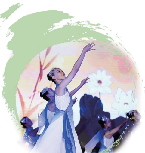
学校舞蹈队带来的舞蹈《风》

重要时期。因此,十一中在诚实守信、遵守校纪、孝敬父母、尊重老师等品质问题上对学生的要求和管理格外严格,可以说是绝不放松、绝不通融。“教育的艺术不在于传授知识和本领,而在于激励、唤醒和鼓舞。”校园内,博观楼、行健馆、有知路、思源餐厅、桃林广场等一系列特色鲜明的文化符号,强调了中华优秀传统文化的传承与发展,激励着师生坚定理想信念,锤炼意志品质。