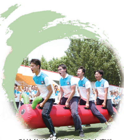
科技体育艺术节之毛毛虫赛跑