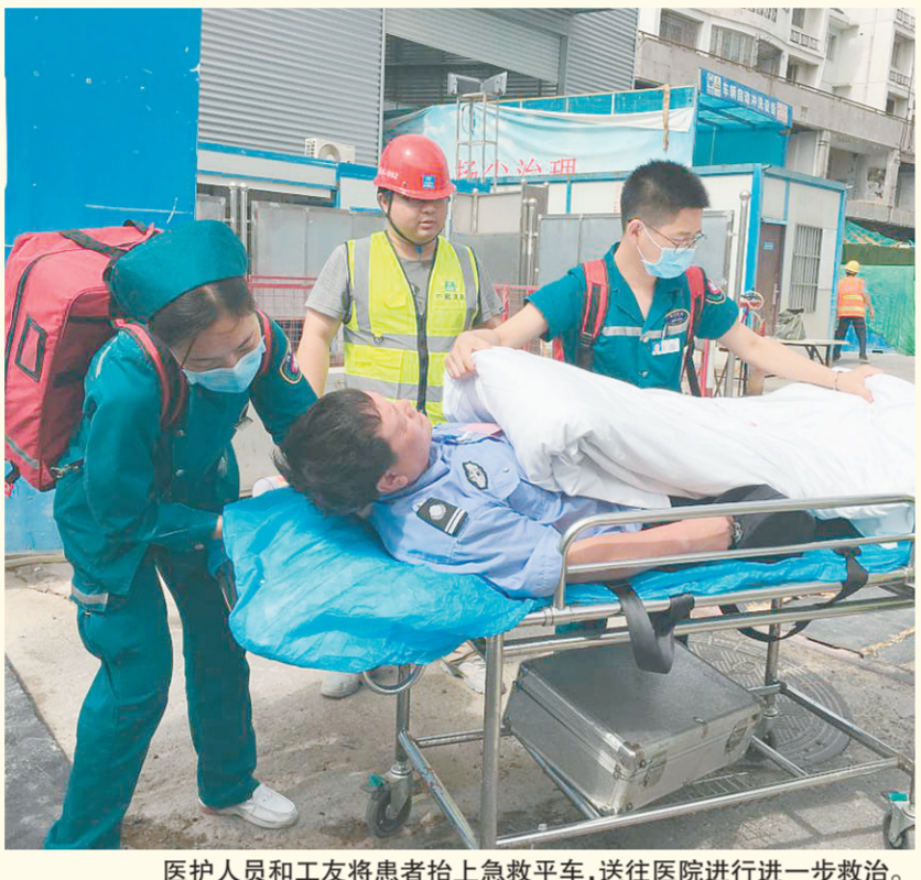
医护人员和工友将患者抬上急救平车,送往医院进行进一步救治。

据了解,本批援助赞比亚医疗队队员将前往非洲,执行为期一年的援外医疗任务。在偌大的机场中,他们团结协作抢救患儿的场景温暖了在场的所有人。这是郑医的第27起正能量事件,也是参与人数最多的一次。网友纷纷点赞:“郑医好人仍在涌现,郑医现象仍在升温,郑医文化仍在传承。”