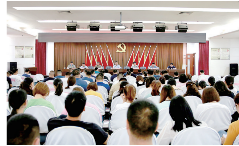
传达市领导指示精神