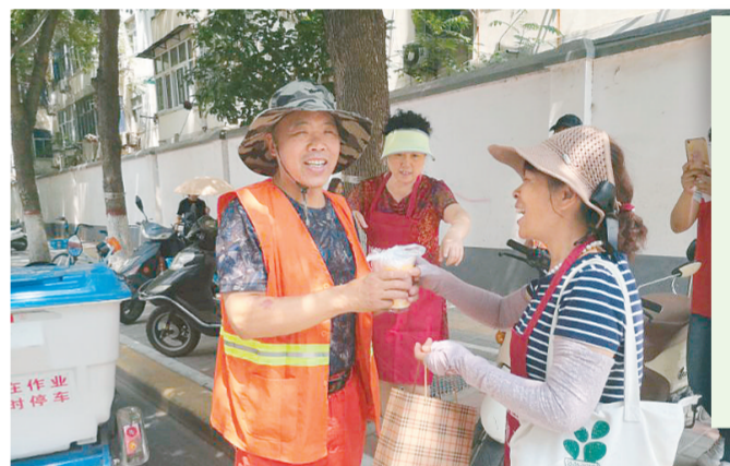
昨日,金水区同行社会工作服务中心联合“淑霞靓汤行动”项目、彩虹社工、农业园社区以及社区志愿者在街头开展赠送酸梅汤公益公益活动,为环卫工人、交通协管员等户外工作者送去夏日清凉。