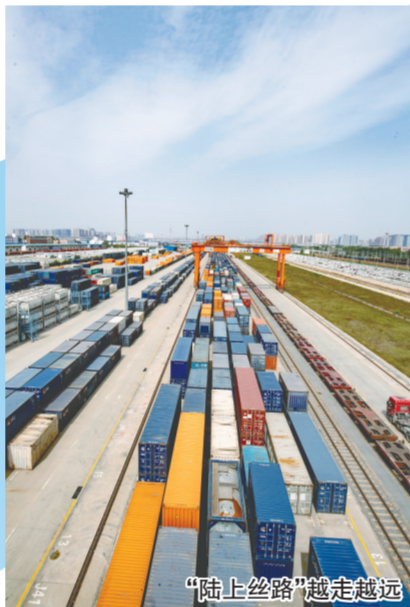
“陆上丝路”越走越远