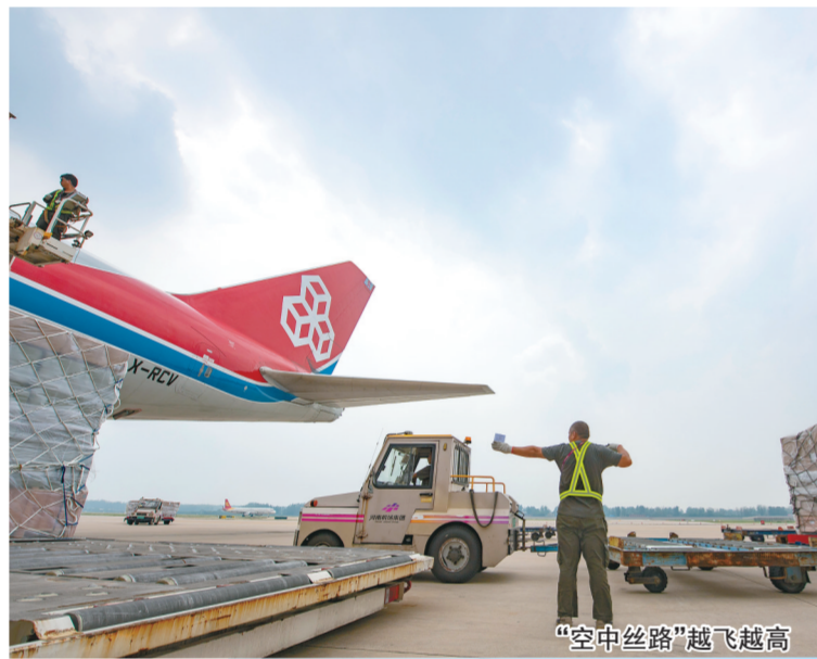
“空中丝路”越飞越高