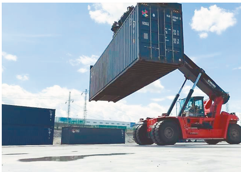
繁忙的中欧班列乌鲁木齐集结中心货场