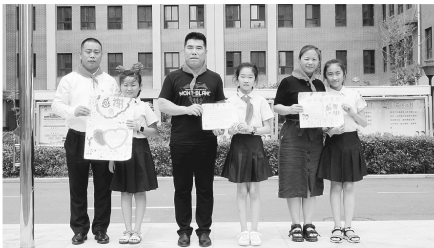
中原区锦绣小学启动动感红领巾暑假研学

又是一年六月天,又是一年毕业季。六月,是离别季、感恩季,也是收获季。我市不少学校都在近期举行了丰富多彩的毕业季主题活动,孩子们在挥洒汗水后迎来了收获,也在与师生的依依惜别中畅想美好未来。