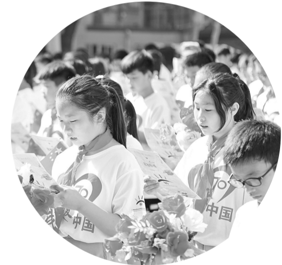
回民一小毕业生齐声诵读

感恩、惜别、追梦。经开区瑞锦小学的六年级毕业典礼不仅是孩子们最后一次在小学的相聚,更是他们新的起点和希望。6月24日上午,典礼活动在庄严的国歌声中缓缓拉开帷幕。在感恩环节,师生互诉心里话,朴素的话语中饱含着不舍与深情。六年级三位班主任几位哽咽,音乐响起,老师与学生紧紧拥抱。这动人的一幕,让在场的所有人为之触动。137名学生双手接过证书,脸上写满欣喜和自信,他们也牢牢记住了校长的寄语:要学会珍惜,珍惜时间、珍惜现在;要不断学习,学习才能让我们更智慧、更强大、更充盈;要懂得感恩,感恩父母、