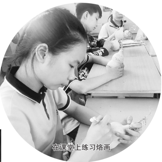
在课堂上练习烙画

葫芦烙画社团活动的开展,使全校师生以及圃田乡人们对传统文化,尤其是列子文化有了更深的认识和体会。圃田教育人正用自己的一双巧手画出心中最美丽的梦想。