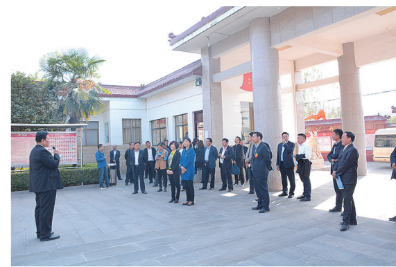
扎实开展“逐村观摩 整乡推进”活动