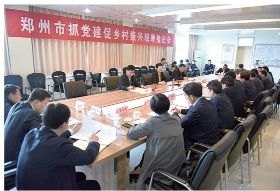
郑州市抓党建促乡村振兴观摩推进会在新密召开

实施乡村振兴战略是以习近平同志为核心的党中央作出的重大决策部署,是加快农业农村现代化的重大历史机遇。实施乡村振兴战略是做好“三农”工作的总抓手,关键在于聚焦产业兴旺、生态宜居、乡风文明、治理有效和生活富裕的总要求,着力推进乡村产业振兴、人才振兴、文化振兴、生态振兴和组织振兴。其中的“组织振兴”主要指基层党组织的振兴。实践证明,基层党组织是实施乡村振兴战略的“主心骨”。