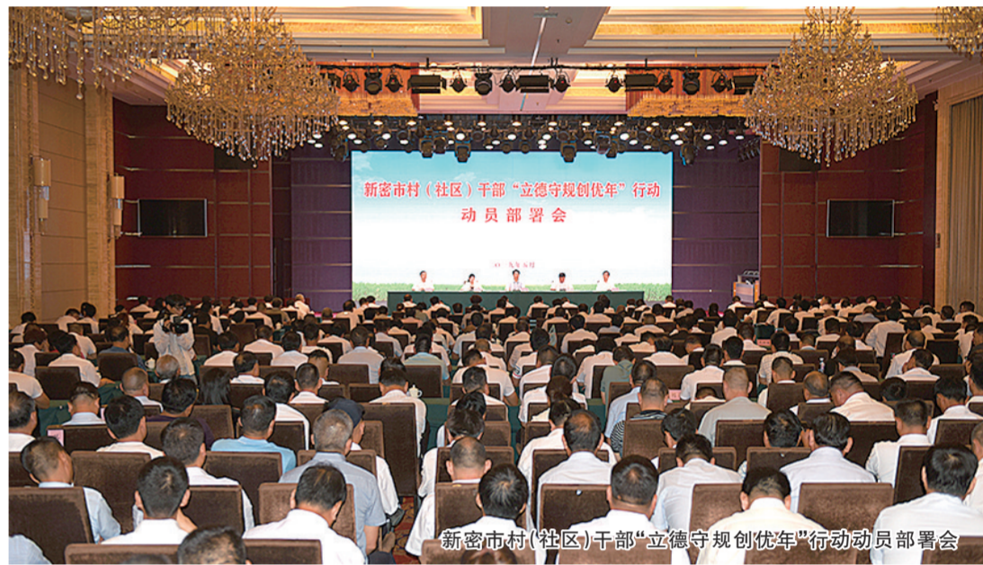
新密市村(社区)干部“立德守规创优年”行动动员大会