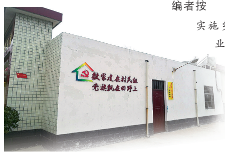
全面推广“一村民组一党小组”工作模式