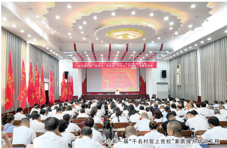
举办新一届“万名村官上党校”素质提升培训工程

坚持把提升组织力作为工作重点,突出政治功能,着力打造引领乡村振兴的坚强基层党组织。一是健全完善体制机制。学习借鉴、深化运用先进地区成功经验,高标准、科学编制乡村振兴规划,形成“15511”总体布局,即:打造1个城乡一体先行示范区,5个示范乡镇,50个示范村,100个高效农业示范园或田园综合体产业化项目,100个森林田园村庄,有效指导全市乡村振兴工作深入开展。制定全市《关于推进乡村振兴战略的实施意见》《关于实施农村党建“八项行动”促进乡村振兴的意见》,按照产业、人才、文化、生态、组织“五个振兴”系统推进的总体要求,以农村基层党建为统领,统筹推进抓党建促脱贫攻坚、促乡村振兴,引导农村基层党组织和党员在乡村振兴中当好组织者、推动者、先行者,在深入组织宣传凝聚服务群众中提升组织力,强化政治功能。二是建强支部战斗堡垒。牢固树立一切工作到支部的鲜明导向,以支部规范化建设为抓手,围绕基层党建“基本组织、基本队伍、基本活动、基本制度、基本保障”,制定健康支部10条标准,通过定期测评、动态调整、晋位升级,确保三年内达到98%以上。坚持问题导向,每年按10%的比例,倒排确定一批软弱涣散村级组织,坚持“一村一策”,按照“六步工作法”集中整顿,推动后进党支部转化升级、不断巩固。2016年以来,全市共摸排整顿软弱涣散村级组织77个,查找突出问题11项230多条,制定整改措施310多条。全面推行“一村民组一党小组”模式,在全市村民小组建立党小组2705个,按照“八有五上墙”标准逐步建立党小组活动室,使党小组成为组织管理党员、党员发挥作用的前沿阵地。扎实开展“逐村观摩、整乡推进”活动,明确“三有四清五规范”的主要任务,与村级换届、问题整改、示范点创建、知识测试深度融合,每季度组织一次观摩评比,每半年组织一次总结点评,全面提升农村基层党建整体水平。强力推进村级集体经济空壳村“清零、消薄”行动,坚持试点先行、“一村一品”,总结推广12个试点村经验,拓宽源头发展壮大新型集体经济,不断增强村级“造血”功能。三是突出人居环境整治。坚持把改善农村人居环境整治作为实施乡村振兴战略的首场硬仗,扎实推进“四美乡村”(环境美、田园美、村庄美、庭院美)建设,引导全市各级党组织把人居环境整治作为“惠民工程、发展工程、小康工程、作风工程”来对待,使党员干部在思想上紧起来,行动上快起来,效果上实起来,汇聚起推进人居环境整治的强大动力。积极构建完善“1+5”城乡污水处理体系,全市农村污水处理率达50%以上,高于全国、全省平均水平。全面推进农村改水改厕改厕改治“四改”工作,新建改建城乡公厕116座,农户改厕改厕改治6.8万户,今年年底前10万农户改造任务全部完成,所有城乡群众都能用上干净卫生厕所。探索形成“户投放、组保洁、村收集、镇转运、市处理”的垃圾处理新模式,生活垃圾日处理量达到600吨以上,建筑垃圾消纳能力达到230万立方米。全省第三次农村人居环境整治工作推进会在新密召开。