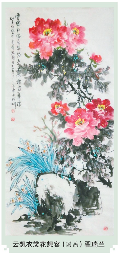
云想衣裳花想容（国画）翟瑞兰

读放翁先生晚年的诗，有时候我还会想到钱锺书先生的论述，他说放翁诗的特点有两个方面，一是“忠愤”；二是“咀嚼出日常生活的深永的滋味”，并说“陆游全靠这第二方面去打动后世好几百年的读者”。我真的很佩服钱先生对放翁诗的评价和判断，这个特点在放翁晚年的诗作中体现得更是淋漓尽致，我即是被这“深永的滋味”所吸引、所感动的。