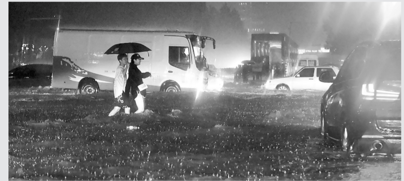
行人和车辆在雨中前行

根据市气象部门天气预报，今后几天郑州的天气情况为:2日，多云，午后有阵雨、雷阵雨，东南风2~3级，最低气温25℃~26℃，最高气温31℃~32℃。3日:多云，有阵雨、雷阵雨，气温25℃~31℃。4日:多云，气温25℃~32℃。