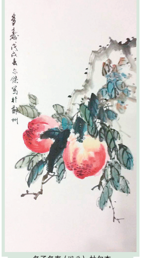
多多多寿(国画) 杜尔杰

基础的,没有一开始基础的学习,想要真正地写好花体字确实很难。由快读慢活出品的《玩转英文花体字》是由英国花体字艺术家梅根·威尔斯所著。威尔斯多年来从事花体字的设计,深知写好一手漂亮的花体字应该具备的条件。在《玩转英文花体字》一书中,威尔斯从最基础的花体字衬线开始讲解,可谓是手把手教学。本书讲解了近几年最流行的5种花体字的写法,还讲解了在不同的运用场景使用不同的工具如何书写花体字。