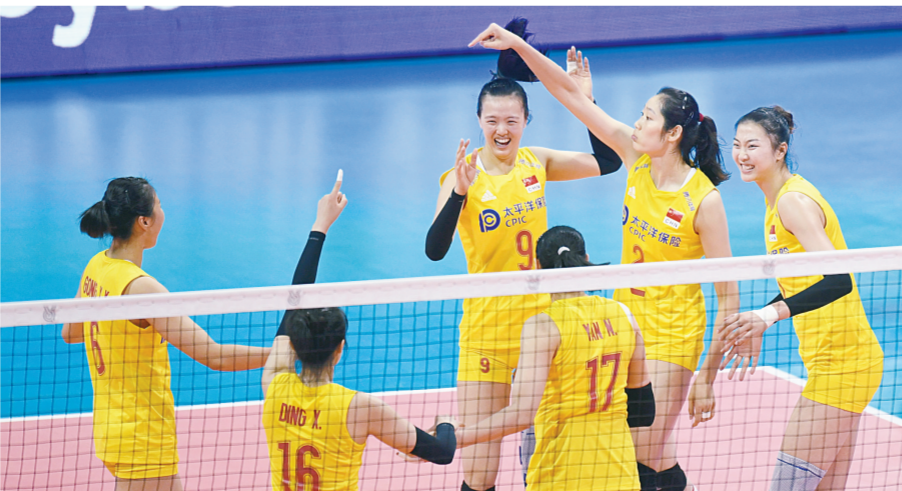
8月4日,中国队员在比赛中庆祝得分。当日,在浙江宁波市北仑区举行的2019国际排联奥运东京奥运会女排资格赛B组比赛中,中国队3:0击败土耳其队,以3战全胜的成绩夺得B组第一,直通东京。

作为油画家,马刚是沉静、细致又深邃的;作为中国人,马刚又具有热血和豪爽的一面。作为中国画家的马刚,则会不断寻求突破、创新,来带给观众新的思考和艺术的享受。