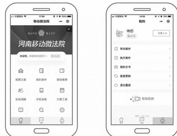
河南移动微法院微信页面截图

本报讯(记者 鲁燕 实习生 史留洋 通讯员 韩旭) 昨日,记者从省高院获悉,“河南移动微法院”正式上线。“一部手机+微信账号”,足不出户,轻动指尖,就可以随时随地在手机上进行在线立案,实现移动全流程诉讼。据了解,“河南移动微法院”是省高院依托手机微信小程序开发的一项服务,提供了一种全新的诉讼服务形态。打开微信一发现一小程序,搜索“河南移动微法院”进入小程序。点击“我的”,选择当事人、法官或者代理人角色进行切换身份。原本需要在电脑上完成的立案申请,现在可以利用出差、旅行等一切碎片时间“指尖”完成,真正实现了“让信息多跑路,让群众少跑腿”。