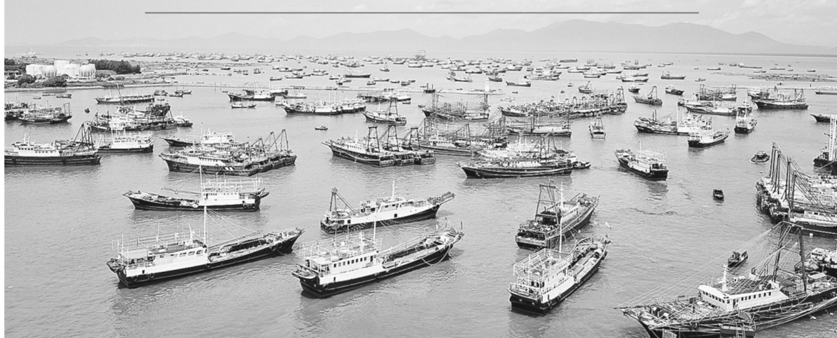
8月15日至16日，第17届南海(阳江)开渔节在广东阳江海陵岛举行。今年的南海休渔期也在16日正式结束，这一天，渔民们再次开始了在渔船上的辛勤劳作，向广阔的大海进发。新华社记者