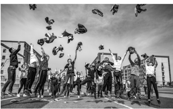
第七届体育节暨荥阳市中小学生学习春季运动会开幕式篮球操表演

对美好生活的向往,更好的教育被摆在了第一位。党的十八大以来,上街教育走过了波澜壮阔的改革发展历程,发生了深层次变革,取得了全方位成就。