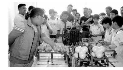
实验小学科学课堂

港区教育,风帆正举。假以时日,国际化、现代化的港区教育必将助推港区城市文明和社会事业发展,也必将为港区各项事业一起,成为中原经济区乃至更大区域发展的“名片”“龙头”和“引领”,为港区发展提供人才支撑,为郑州航空港大都市建设筑牢“发展之基”“人才之基”。