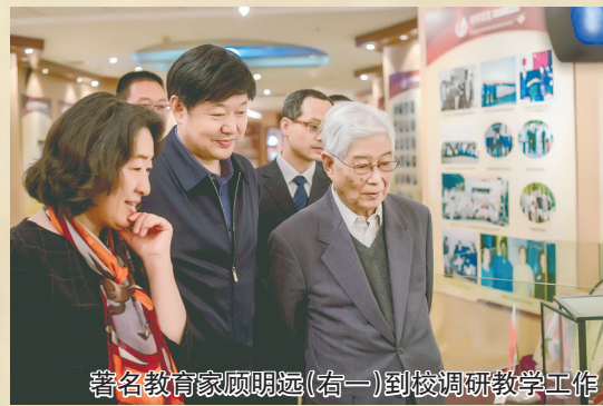
著名教育专家顾明远(右一)到郑州一中调研教学工作

教育兴则国家兴，教育强则国家强。教育是提高人民综合素质、促进人的全面发展的重要途径，是民族振兴、社会进步的重要基石，是对中华民族伟大复兴具有决定性意义的事业。