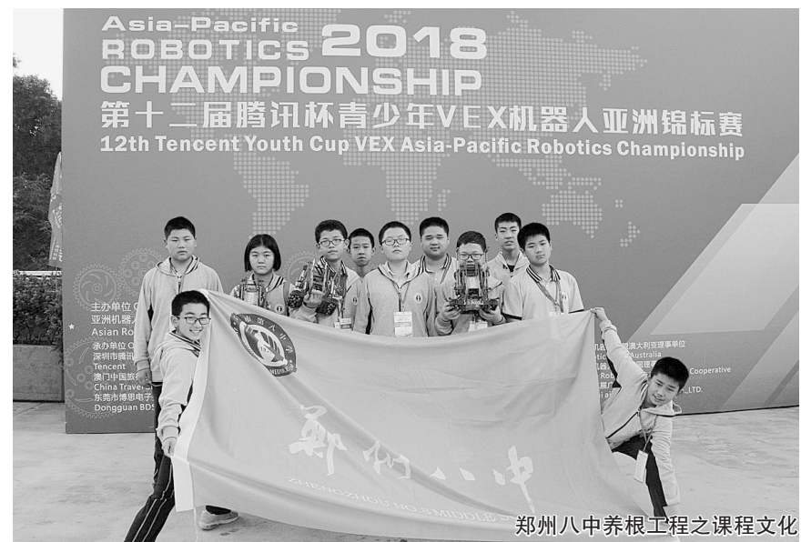
郑州八中养根工程之课程文化

课程成就每一个孩子，学校一直致力于校本课程建设，让课程为学生提供支撑生命成长的“营养元素”，构建了责任担当课程、健康生活课程、阳光学习课程、实践创新课程四个维度的课程框架，开发了系列校本课程，从而满足学生的