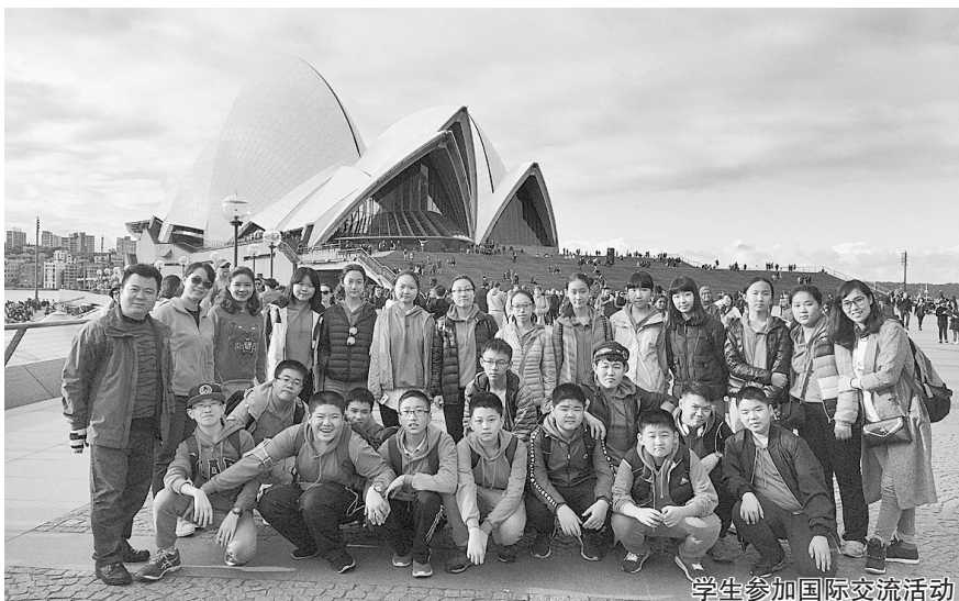
学生参加国际交流活动

围绕着“三生文化”，五十七中还提出了“生命的真实、生存的有趣、生活的味道”课堂教学理念，让学生真正成为课堂求知、求真的主人。学校通过观课、议课、评课，及时纠正共性问题，让老师控制讲解时间，退出主角地位，把更多的话语权、学习时间、学习活动还给学生，把课堂真正还给学生。课堂里悄然发生着变化，孩子们不断收获着成长。一个个鲜活的生命，在郑州五十七中这块沃土上沐浴着阳光、吸收着营养、浸润着书香，茁壮成长。在德智体美劳“五育”润泽下，绽放出七彩般的光芒，让他们在郑州五十七中遇见最好的自己。