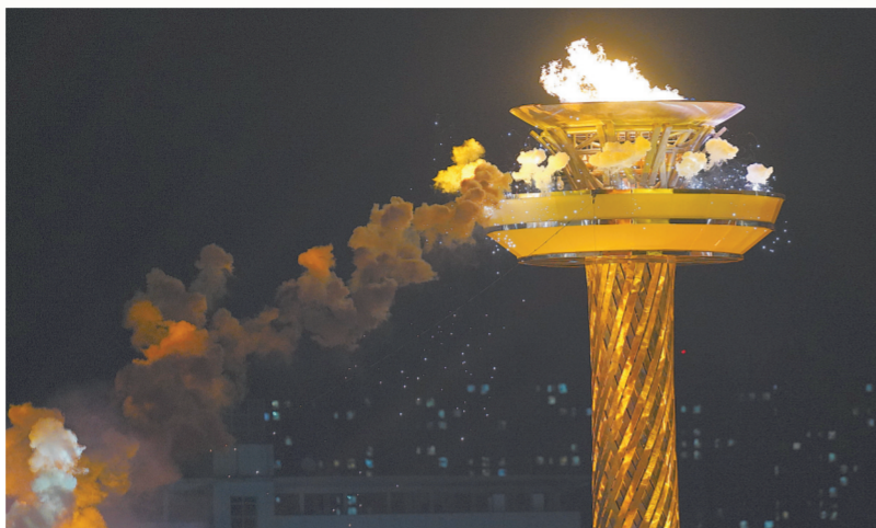
主火炬被点燃

第十一届全国少数民族传统体育运动会开幕式上最激动人心的一刻，莫过于圣火点燃的那一瞬间。21点45分，最为神秘的点火仪式正式揭开面纱，火炬手共同点燃主火炬，熊熊火焰点亮了整个夜空，衬托得奥体中心体育场璀璨绝美，也将开幕式推向了最高潮。