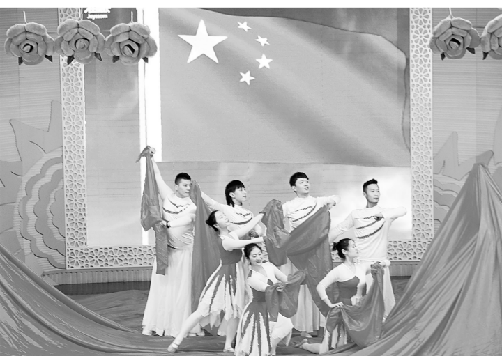
近日,省直机关第一幼儿园园培项目“幼儿园骨干教师访名校浸润式培训”研修班开班。图为开班典礼上,优秀教师表演舞蹈《红旗颂》。

改善的是环境,凝聚的是民心。该负责人说,在社区治理工程中,随着日益变美的环境和不断提升的生活品质,广大群众的心与党委、政府贴得更近了。接下来,还将通过压实责任、强化奖惩等方法进一步推进小区改造和社区治理,让群众拥有更加美好的生活。