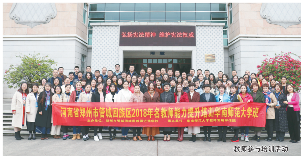
教师参与培训活动

古老而厚重的历史文化使管城教育在积淀中传承使命。在全区54所中小学中，于新中国成立前创办的就有16所，其中创办于1904年的南学街小学，原名郑县官立高等小学堂，距今已有115年的历史；前身为北大街清真寺街小学的管城回族区回民第二小学，创办于1908年，距今111年；创办于1928年的创新街小学，距今91年历史；始建于1937年的南关小学，距今已有82年办学历史，一座座学堂目睹着管城教育的发展，也见证着郑州城市的发展演变。近年来，管城回族区教体局在管城回族区委、区政府的坚强领导下，始终坚持教育优先发展战略，以商都历史文化区建设为契机，创新工作机制，加快教育改革。