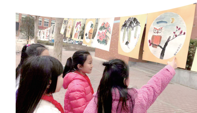
同学们在欣赏书画社的作品

漫步在港湾路小学校园里，扑面而来的是浓郁的文化气息。作为管城回族区的一所城区小学，学校把富有文化表征和教育意义的植物文化融入到了学校的校园里。校园内有