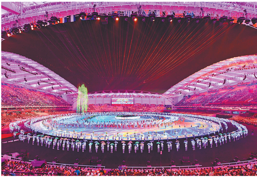
这是开幕式现场(10月18日摄)。

随后,开幕式文艺表演《和平的薪火》拉开序幕。文艺表演上篇“泱泱华夏·生生不息”,分文明之光、和合之道、江山如画、丝绸之路、星星之火5个节目,通过回溯历史,展现源远流长的华夏文明和博大精深的中国古代军事文化,及其为推动人类社会进步作出的重要贡献。下篇“路路相连·美美与共”,分和平之师、新的天地、