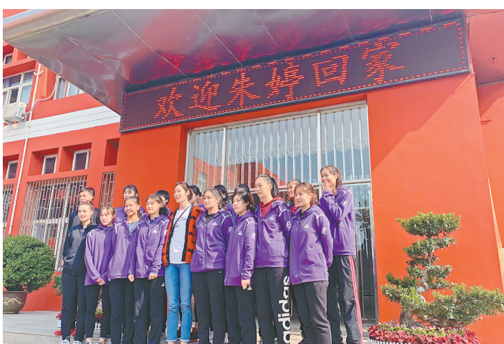
朱婷与河南女排姑娘们合影留念

10月19日,中国女子排球队长朱婷回到家乡河南,受到河南球迷的盛情迎接,当天还到访了位于郑州的河南省球类运动管理中心,与河南省女子排球队交流互动。