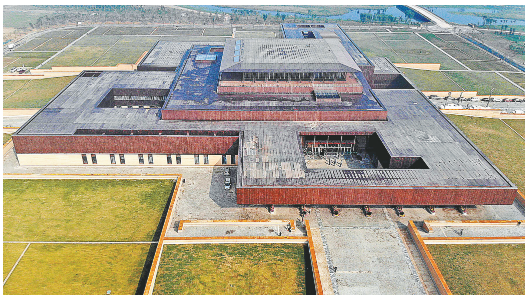
这是10月19日无人机拍摄的二里头夏都遗址博物馆

新华社郑州10月19日电(记者 桂娟 双瑞)历经两年多建设,备受关注的二里头夏都遗址博物馆19日正式开馆。青铜器、陶器、玉器、绿松石器、骨角牙器等2000余件藏品,集中展示了二里头遗址作为“华夏第一王都”的丰富内涵。