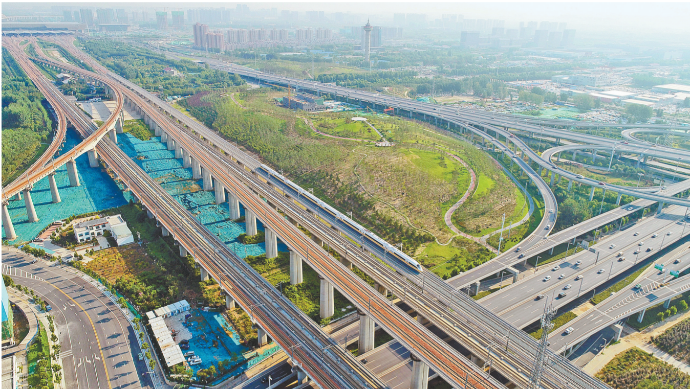
中原至长三角再添新通道

本报讯(记者张倩 通讯员赵晶晶 梁展文)26日,记者从中国铁路郑州局集团有限公司获悉,商合杭高铁合湖段将于6月28日开通运营,标志着商合杭高铁全线贯通,河南、安徽、浙江三省实现