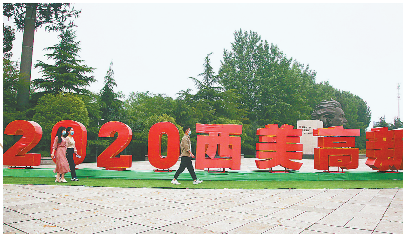
科学大道与瑞达路交叉口街景