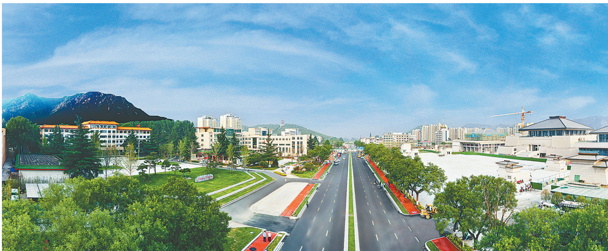
升级改造后的少林大道街区

一条城市主干道，一条百姓眼中的“寻常路”，一条连接嵩山与登封城市的主要道路……已经焕然一新。以此为契机，沿着这条大道的各项城市基础设施改造和高品质建设之路，也在徐徐铺展——