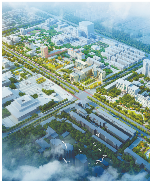
少林大道街区升级改造设计效果

不久的将来，中外游客在登封不但能看名山揽名胜，还能在城区享受到舒服、便捷的高质量旅游服务，在“慢游”中细细品味“天地之中”。