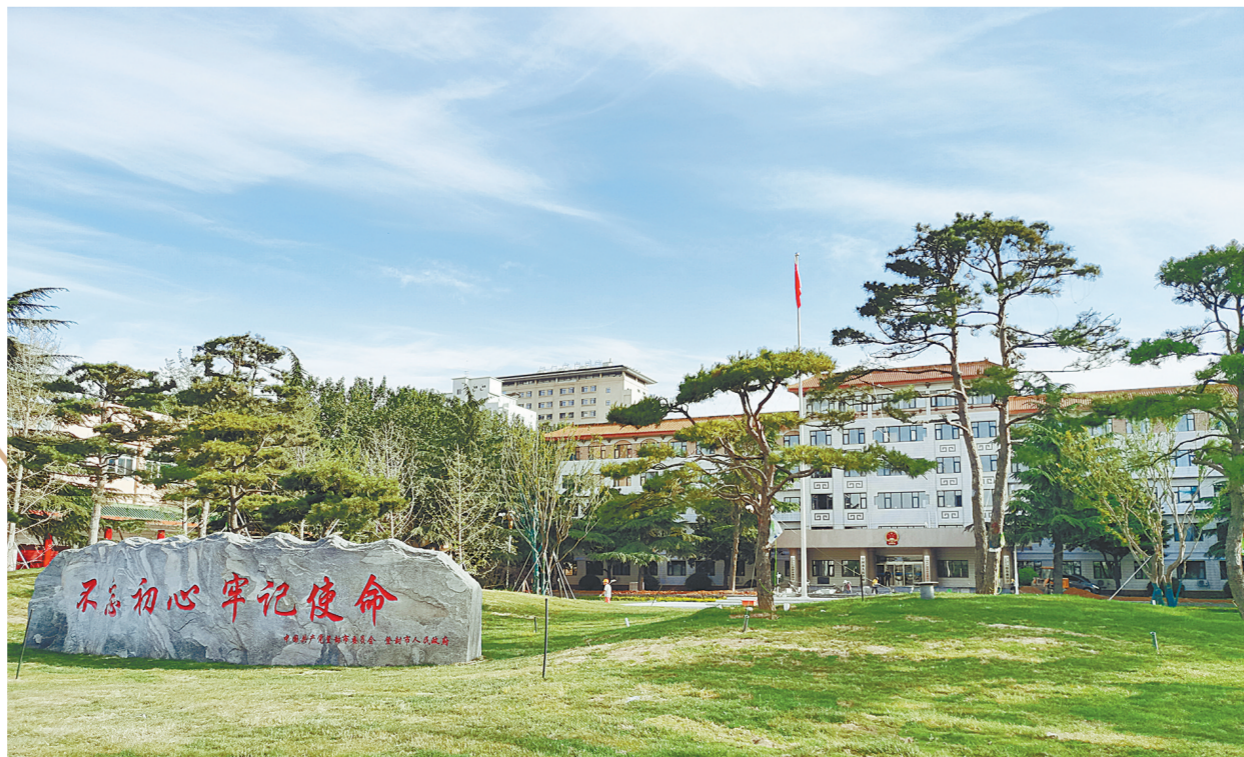
少林大道共享绿地空间

在福佑路上地势高差大的路段，临街建筑、人行道和非机动车道、机动车道分别处于三个高度平面，其间通过挡墙或绿化带相分隔，道路的通行效率大大增强。