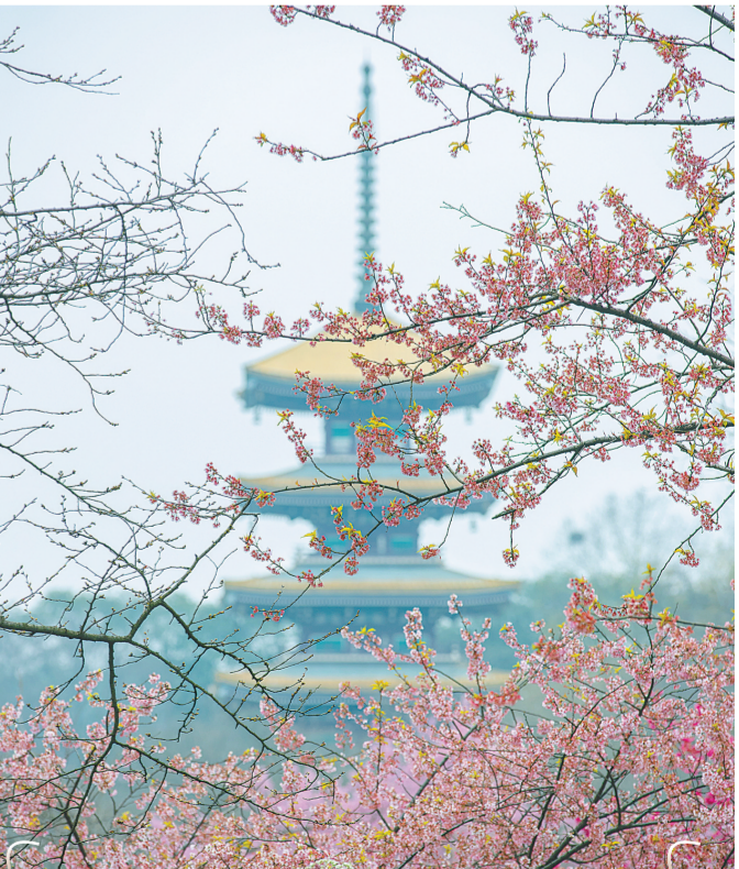
武汉东湖樱花绽放 这是2月27日拍摄的武汉东湖樱花园内开放的樱花。当日,武汉东湖樱花园开园,东湖樱花节同步举办。园内绽放的樱花和文艺表演吸引游客前来赏花观景,放松心情。