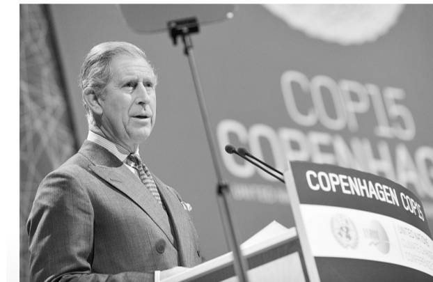
这是2009年12月15日,查尔斯在丹麦首都哥本哈根举行的联合国气候变化大会高层会议开幕式上致辞的资料照片。