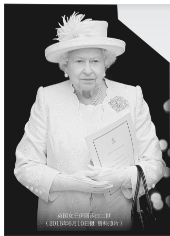
英国女王伊丽莎白二世8日在苏格兰巴尔莫勒尔堡去世,享年96岁。大量民众当天聚集在白金汉宫外,悼念这位英国历史上在位时间最长的君主。

同日,国务院总理李克强向英国首相特拉斯致唁电,对伊丽莎白二世女王逝世表示哀悼,向女王亲属和英国政府表示慰问。