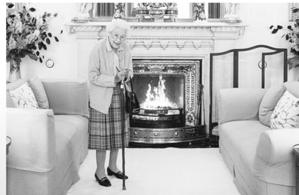
这是英国女王伊丽莎白二世在苏格兰巴尔莫勒尔堡的资料照片(9月6日摄)。

8日晚间,白金汉宫门前摆满鲜花和蜡烛,伦敦各地布告牌亮起女王肖像。据路透社报道,英国将进入为期10天的全国哀悼。