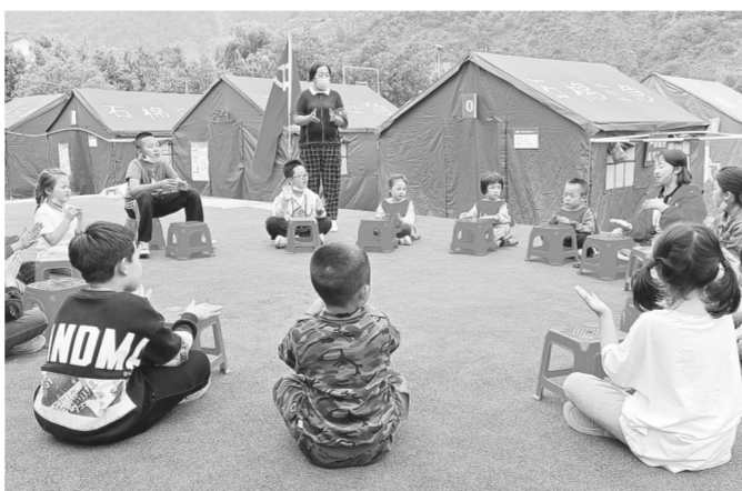
9月8日,在四川省石棉县新民乡海耳村临时安置点,老师带领孩子们做游戏。四川省甘孜州泸定县6.8级地震发生后,在雅安市石棉县的临时安置点里,老师和志愿者们带领孩子们学习、画画、做游戏,在这个特殊时期安抚和陪伴他们。