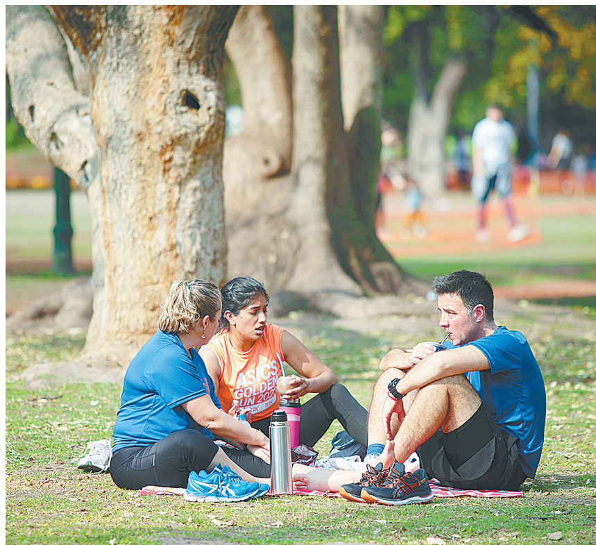
8月6日，人们在阿根廷首都布宜诺斯艾利斯的一处公园休闲。近期，正值冬季的阿根廷、智利等南美国家部分地区遭遇异常高温天气。