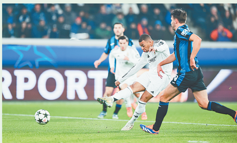
姆巴佩(右二)在比赛中射门得分