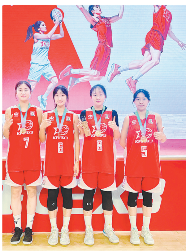
河南省实验中学女篮队员赛后合影

肯德基中国中学生3x3篮球联赛由中国学生体育联合会与肯德基中国共同打造,设有初中组、高中组两大组别,赛程从9月持续至12月。今年,恰逢该项赛事举办的第20个年头,历经二十载不断发展壮大,该项赛事吸引了全国近300万青少年参与其中,在推动中国三人篮球运动普及,持续为中国篮球输送人才的同时,也为青少年体教融合事业做出了突出贡献。目前,该项赛事已经成为国内规模最大、覆盖面最广的中学生三人篮球赛事。