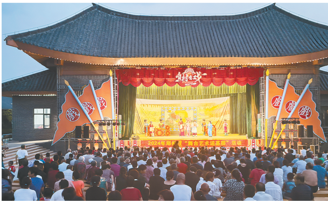
8月23日,郑州市戏剧艺术保护传承发展中心(曲剧团)在登封市朝阳沟村演出(资料图片)

光影为纪,盛世莲开。中影始终深度聚焦港澳电影文化交流、产业发展。澳门回归祖国25周年之际,由北京宣传文化引导基金、澳门特别行政区政府文化发展基金共同扶持,由中影股份创作出品的电影《多想和你再见一面》《幸运阁》深情诉说澳门与祖国同根连枝、携手向前的未来发展光影篇章,为澳门回归祖国25周年送出一份珍贵礼物,以此祝福澳门与内地交融并进、和谐共生的明天。