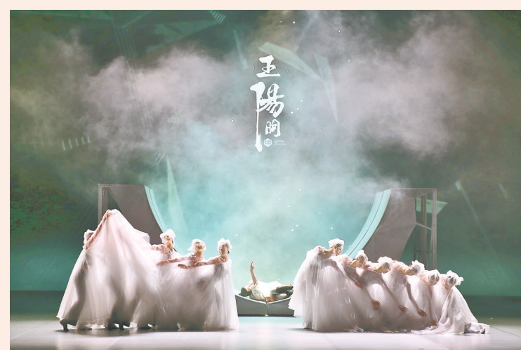
舞剧《王阳明》在郑上演

本报讯(记者 左丽慧)12月10日至11日,由贵州文化演艺集团出品,贵州省歌舞剧院制作演出、青年舞蹈家王亚彬导演的舞剧《王阳明》在郑州大剧院精彩上演,为省会观众送上了一场宏大的视觉盛宴。舞者灵动且极具表现力的表演深深吸引观众情感的共鸣,赢得掌声久久不断。