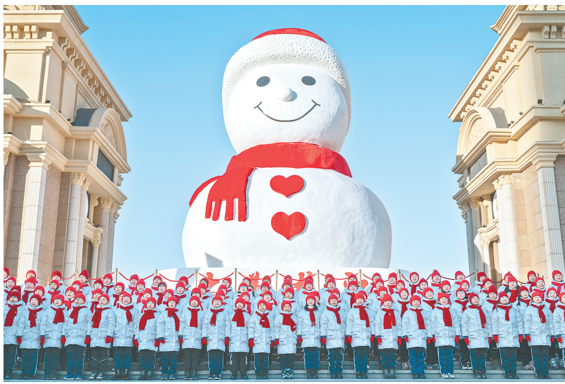
12月17日,小学生在哈尔滨松花江畔的大雪人前表演。当日,哈尔滨“网红”大雪人“回归”松花江畔。

2016年至今,郑州大学蝉联了国家级最高赛事全国荷球锦标赛(CKA)冠军及全国学生荷球锦标赛(CUKA)冠军。郑州大学代表中国队参加29次国际大赛、10次国际邀请赛。2019年代表中国国家队获得世界锦标赛第四名(南非),2017年、2022年两次荣获世界运动会荷球比赛的第五名(美国),创历史最好成绩。