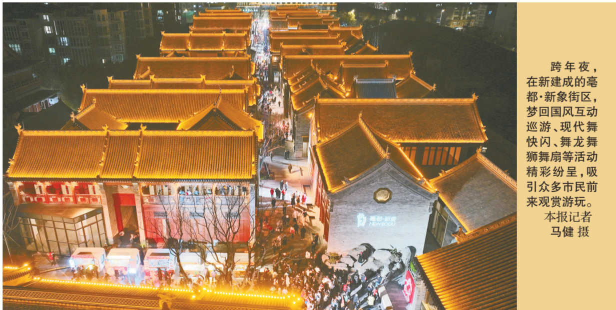
跨年夜，在新建成的亳都·新象街区，梦回国风互动巡游、现代舞快闪、舞龙舞狮舞扇等活动精彩纷呈，吸引众多市民前来观赏游玩。

长跑后，何雄一行来到奥体中心体育场，与市民群众一起参观非遗集市、体验趣味运动，共庆元旦佳节。