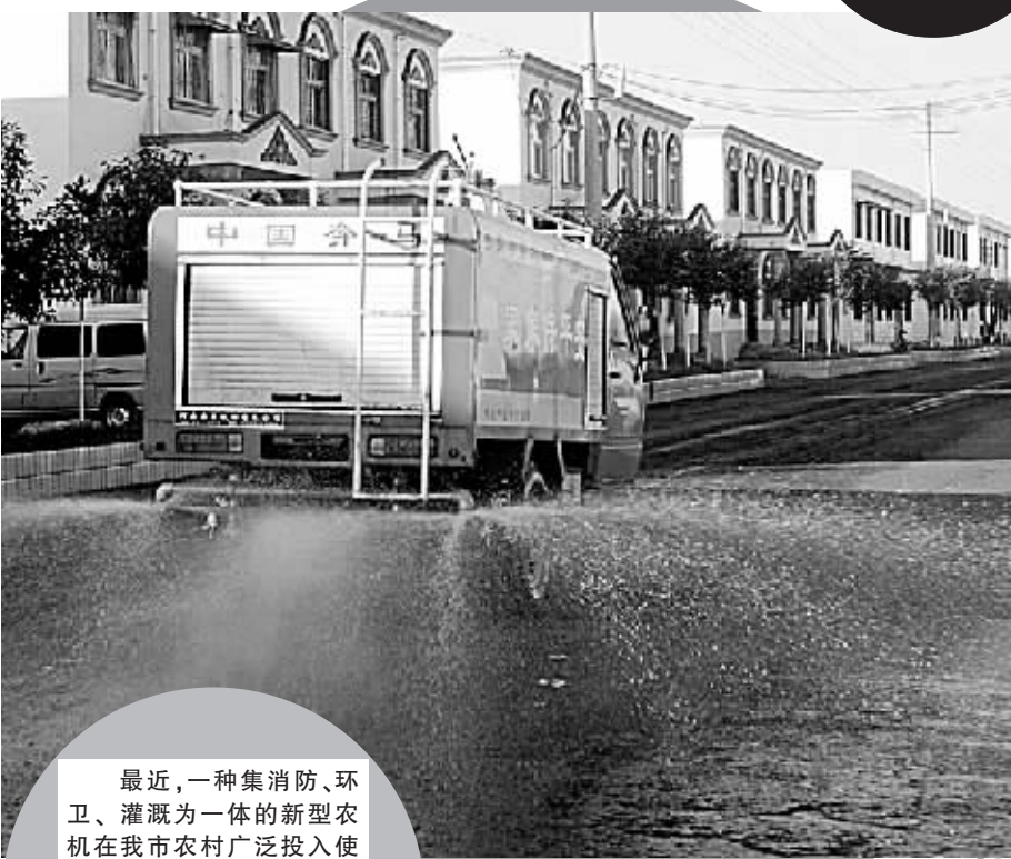
最近,一种集消防、环卫、灌溉为一体的新型农机在我市农村广泛投入使用。据农机部门介绍,该机械体积小、灵活性强,很适合农村的实际情况,今后要在全市各村推广。