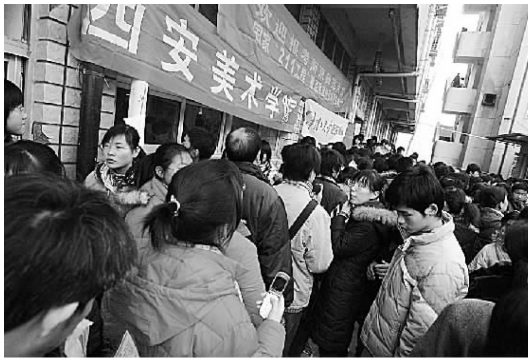
昨天是省外艺术高招单独组织考试在河南开始的第一天,郑州市第106中学考点在严寒中呈现出非常火爆的场面,当日考生超过5000名,创历年首日考生人数之最。本报记者 宋晔 丁友明 摄

今年,我省的“红十字博爱送万家”活动又多方筹措物资价值达81万元,现正在发往全省各地。