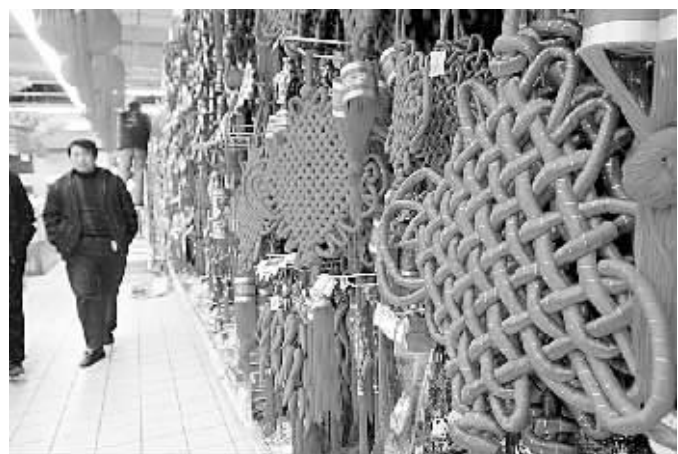
一到年关,精致的手工中国结便会在大街小巷出现,与大红灯笼一起,装点节日气氛。图为商场内热销的中国结。

二七区人民法院审理此案查明,小华跳楼身亡的当天由同学看护,小华趁同学不备,走出病房。病房楼通往楼顶有一门,但门锁的螺栓不牢固,轻易就能打开。法院认为,八院的门锁不牢固,存在安全隐患,未尽到合理限度范围内的安全保障和注意义务,应承担30%的赔偿责任。而小华的监护人及陪护人未尽到完全的监护责任,应承担主要责任。法院遂判决八院赔偿死亡赔偿金、丧葬费共计6.6万元以及精神损害抚慰金2万元。