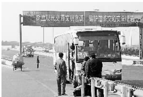
在北环南路立交桥东引桥出口处,常有一些长途车在此违章拉客,很不安全。

法院经审理后认为,袁某故意放火,危害公共安全,其行为已构成放火罪。据此,法院作出上述判决。