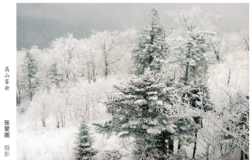
嵩山雾松