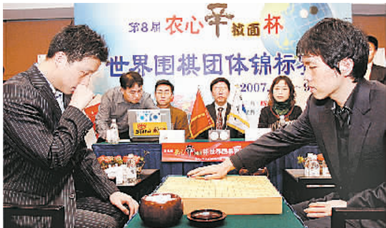
2月9日,韩国棋手李昌镐九段(右)在比赛中执黑落下第一子。当日,在第八届世界围棋团体锦标赛最后一局比赛中,中国棋手古力九段执白以1目半不敌韩国棋手李昌镐九段。最终,中国队获得亚军。

9日,李昌镐冷静击败古力,捧起第八届农心杯世界围棋团体锦标赛冠军奖杯,对“石佛”而言,这是一个久违的冠军,更是一个有力的回答——谁说“李昌镐时代”结束了?